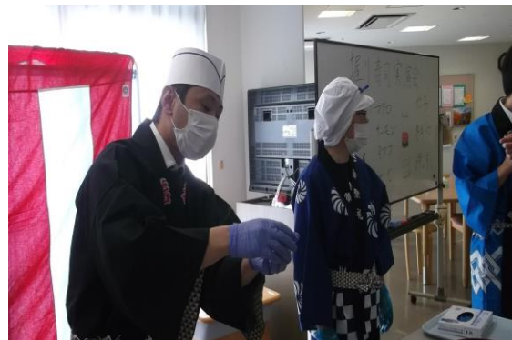
☆真心を込めて握っています！☆