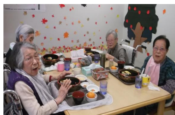
☆美味しく頂きました！☆