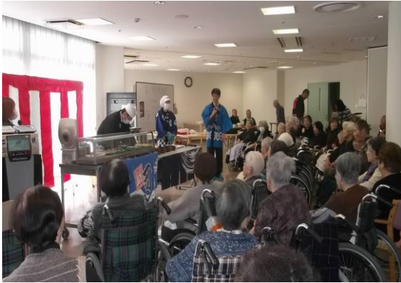
☆「握り寿司実演会」の様子です。☆

12月9日（土）に当施設の食堂で、日京クリエイトの皆様による「握り寿司実演会」を実施し、利用者の皆様に美味しいお寿司を召し上がって頂きました！