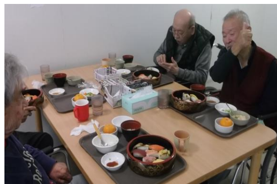
★美味しさに笑顔がはじけますね！★