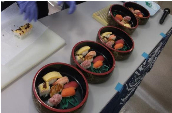
★握りたてのお寿司です！★