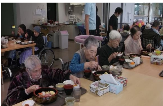
☆皆さん、とても嬉しそうですね！☆