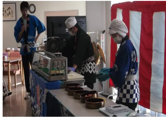
★職人さんの腕が冴え渡ります！★